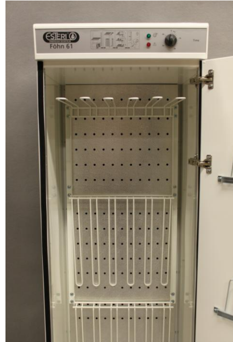
Ainutlaatuinen ilmankierto - kuiva ja lämmin ilman puhalletaan vaatteiden sekaan takaseinän aukoista.

ESTERI FÖHN 61 on kotimainen kondensoiva kuivauskaappi, joka soveltuu päiväkoteihin, siivouskeskuksiin, pukuhuoneisiin jne.